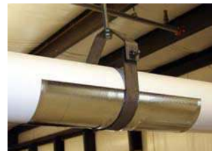
Reste dans le support